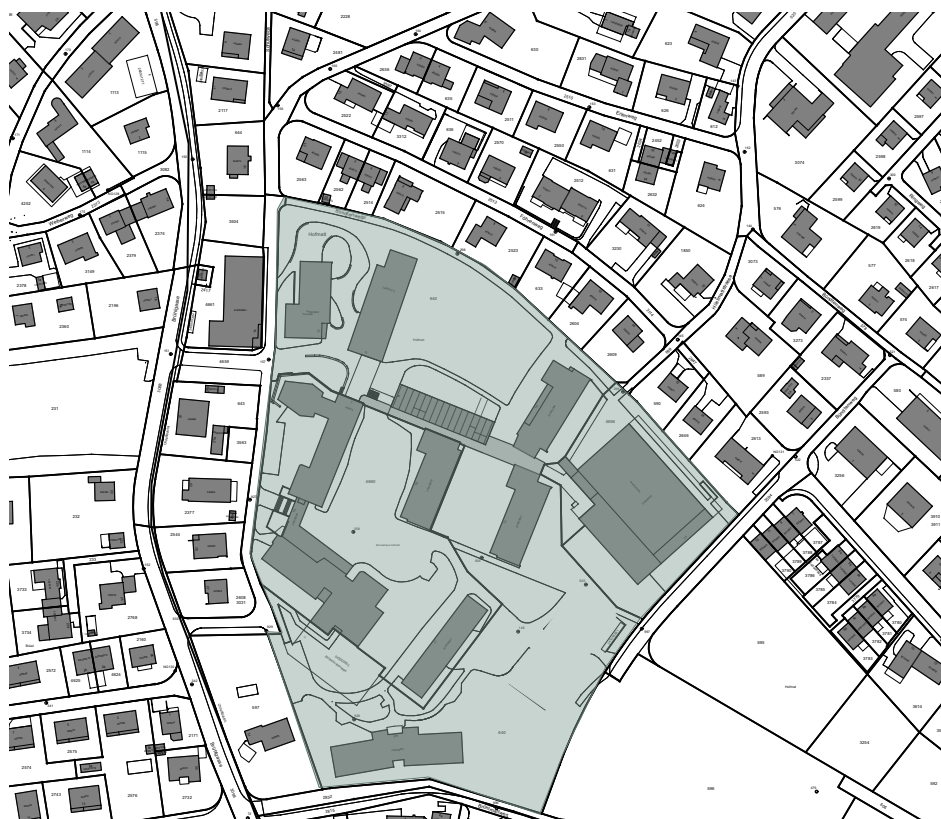
Abb. Situation Schulanlage Ausgangslage

Der Standort des zusätzlichen Schulgebäudes Gelterkinden liegt auf der Parzelle GB N° 377 im Hofmatt, die im Besitz der Einwohnergemeinde Gelterkinden ist. Die gesamte Parzelle hat eine Fläche von 32'780 m 2 und verfügt über eine bereits bestehende Schul- und Sportanlage.