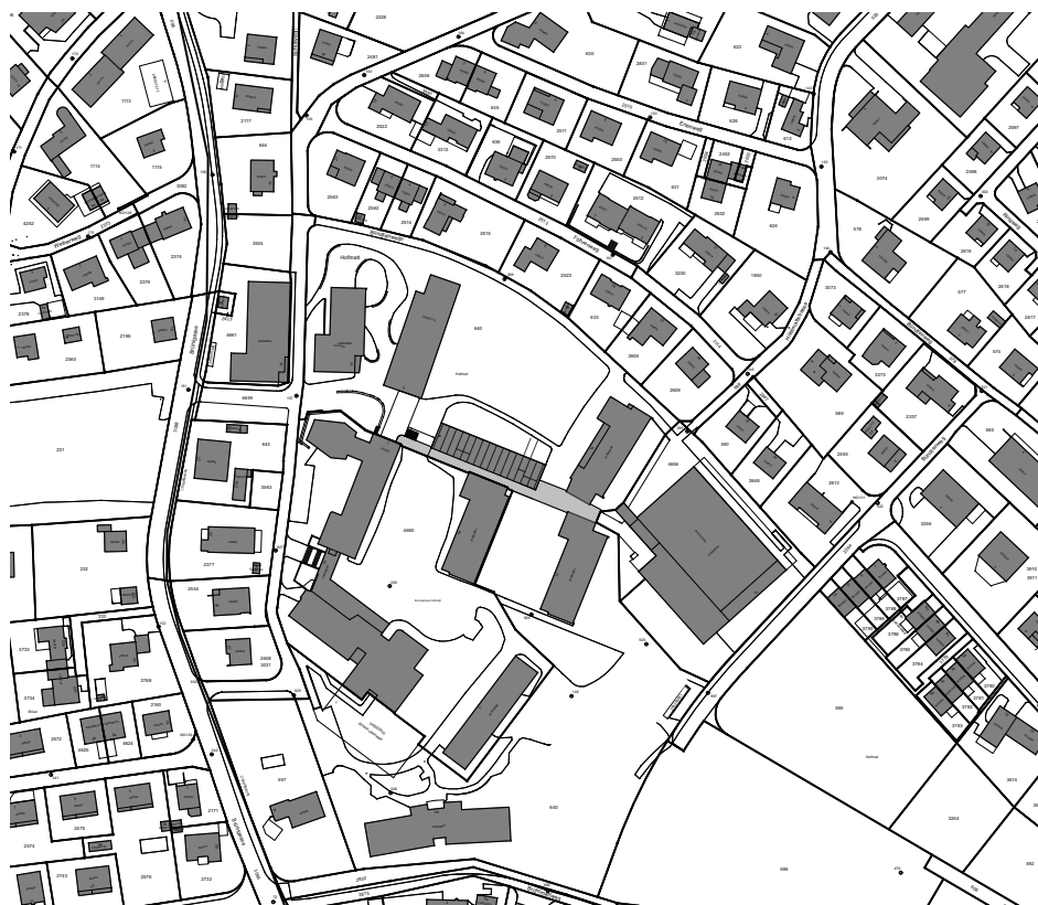
Abb. Situation Ausgangslage (ohne zu ersetzenden Pavillon Ost)

1 Hauswart und 5 Mitarbeitenden in Schulleitung und Sekretariat. Die «Lerninsel» bietet einen zeitlich befristeten Lernort für auffällige Kinder und dient als Entlastung der betroffenen Klassen und Lehrpersonen. An unserer Schule werden Kinder mit speziellen Bedürfnissen auch integrativ gefördert. Für diese Begleitung sind Gruppenräume und flexibel nutzbare Schulzimmer eine grosse Unterstützung. Im Weiteren befindet sich der Logopädische Dienst an unserer Schule, welcher auch Anlaufstelle für Kinder aus den umliegenden Gemeinden ist.